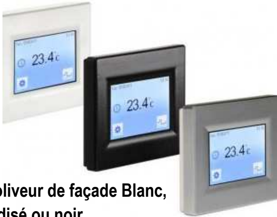
Enjoliveur de façade Blanc, anodisé ou noir