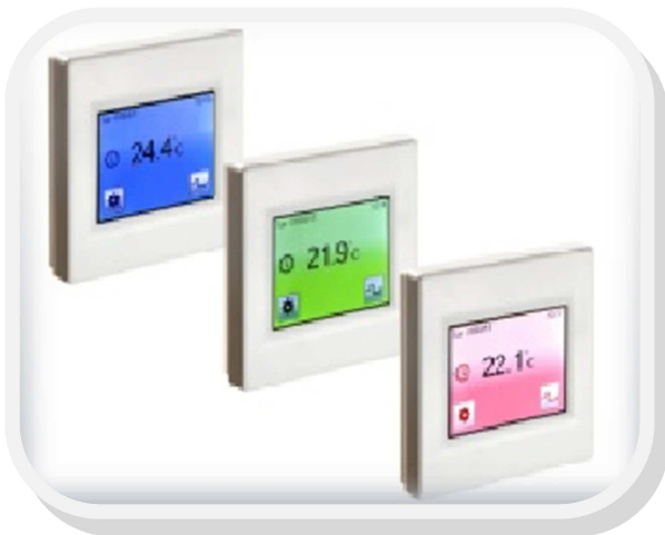
Ecran rétroéclairé de couleur au choix