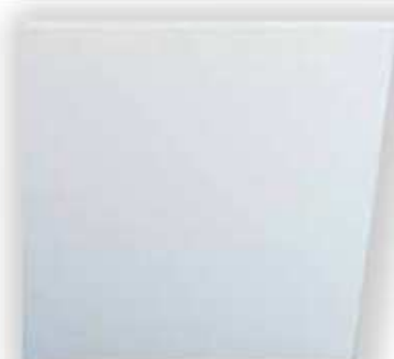
Silice lisse Peau d'orange

** Non tenue en stock / *Coloris selon le RAL nous consulter